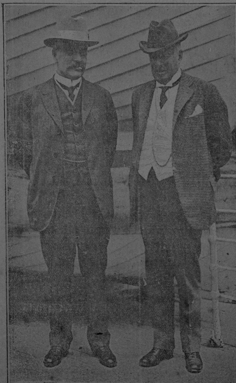
El Primer Ministro Marden.— Sir John Pope.

El Primer Ministro de Canadá declara que ese país puede poner medio millón de hombres sobre las armas